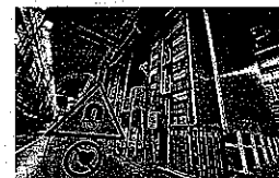
Laboratorio de Gran Sasso.

Una segunda prueba mejorada de los responsables del experimento Opera, el Centro Europeo de Investigación Nuclear (CERN) de Ginebra, ha confirmado la existencia de neutrinos, un tipo de partículas subatómicas, que viajan más rápido que la luz, algo que la física considera imposible hasta la fecha. Los científicos introdujeron en el túnel de 730 kilómetros que une el CERN con el laboratorio de Gran Sasso (Italia) ha-