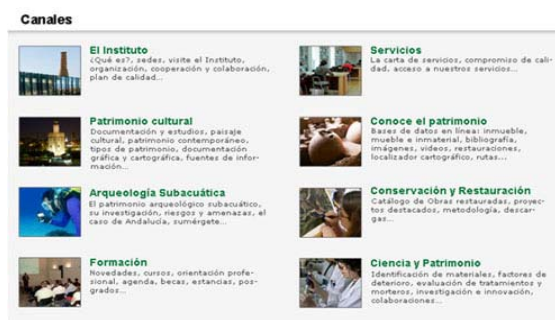
Figura 6. Canales temáticos del nuevo Portal Web

La página Web del IAPH contempla en la actualidad el nivel de accesibilidad A en sus contenidos generales y AA en sus productos en línea. Para la nueva versión actualmente en desarrollo, ampliará su cobertura general aplicando el nivel AA a todos los contenidos.