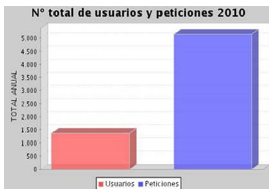
Figura 5. Número de peticiones y usuarios de los servicios en línea (enero- sept. 2010)

A esto se suma que los servicios de la institución cuentan con lo que se puede denominar usuarios-clientes. Es decir, se trata de usuarios leales que recurren repetidamente a la institución, bien a solicitar siempre el mismo servicio, bien a otro distinto.