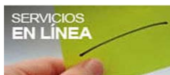
Figura 7. Nueva sección de Servicios en línea

Los Servicios en Línea, por su parte, cuentan con una pastilla de acceso independiente mediante una imagen destacada a aquellos que ofrecen formulario electrónico para su solicitud. Estos han sido diferenciados junto a otros contenidos relevantes de los distintos canales temáticos.